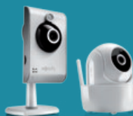
CAMÉRAS INTÉRIEURES VISIDOM IC100 ou VISIDOM ICM100