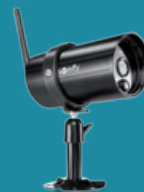
CAMÉRA EXTÉRIEURE VISIDOM OC100